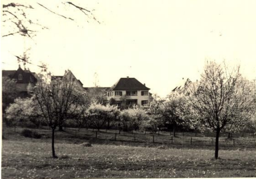
Casa di Heidegger a Friburgo