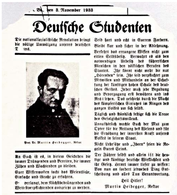
Proclama di Heidegger per gli studenti durante il periodo di rettorato

Nel 1931 il filosofo tedesco è rapito filosoficamente da Platone e partecipa, sulle tracce di quest'ultimo e sorretto da un senso nuovo di responsabilità politica e sociale, alla distruzione della democrazia. La prima metà del corso su Platone, tenuto nel biennio 1931-32, è dedicata all'interpretazione del mito della caverna tratto dalla Repubblica . In tale dialogo il senso della giustizia, come ci dice lo stesso Platone, è racchiuso nel giusto equilibrio dell'anima, sia nell'uomo che nella polis. Tale equilibrio è strettamente legato alla natura dell'anima stessa che è fatta, come il cosmo, di puro essere il quale, semplicemente permanendo, è in opposizione con il divenire. Per Heidegger invece non c'è alcun ideale ontologico della persistenza. Occorre, dunque, interpretare il pensiero di Platone meglio di quanto lo abbia fatto Platone stesso. Il risultato di questa interpretazione è l'individuazione di un'area di distanza che si interpone tra l'uomo e la sua percezione del mondo e di sé stesso, poiché esiste una parte di entrambe che si mostra e un'altra che si sottrae. Ciò significa che esiste uno spazio di gioco in cui risiede la libertà dell'uomo. Tale distanza è chiamata da Heidegger "apertura". Se quest'"apertura" non ci fosse l'uomo non potrebbe distinguersi né da ciò che lo circonda, né da se stesso. Di conseguenza non potrebbe neanche esserci.