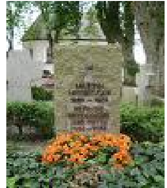
Tomba di Martin Heidegger

Muore il 26 maggio del 1976 e viene seppellito due giorni dopo, come da lui richiesto, nel cimitero del borgo natio.