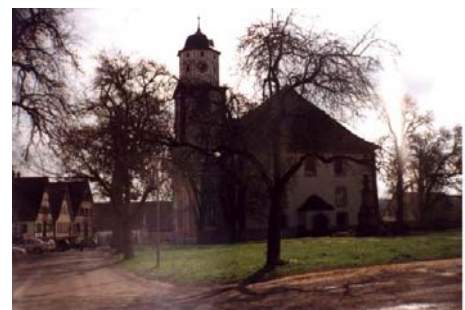
Chiesa di St. Martin a Meßkrik